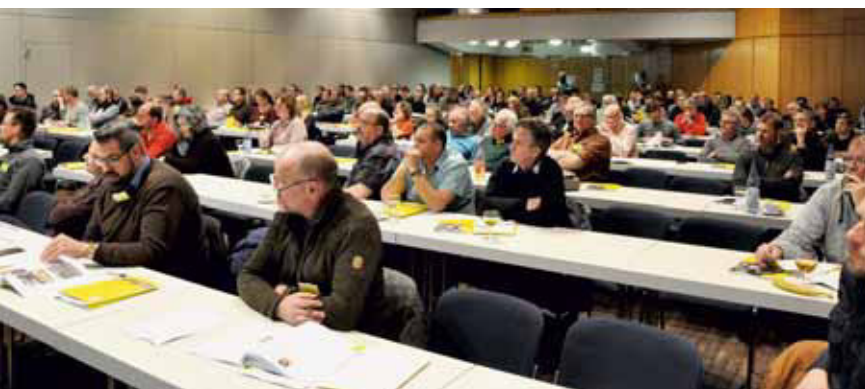
Der Saal war ausgefüllt, das Publikum hoch interessiert

Vom 2. bis 4. Dezember 2019 fanden in Bonn die Verkehrssicherheitstage der Forschungsgesellschaft Landschaftsentwicklung Landschaftsbau e. V. (FLL) statt. Kurz zuvor luden die Veranstalter schon nach Falkensee bei Berlin ein, um den Fachleuten für Bäume und Gehölze ein umfassendes Podium des