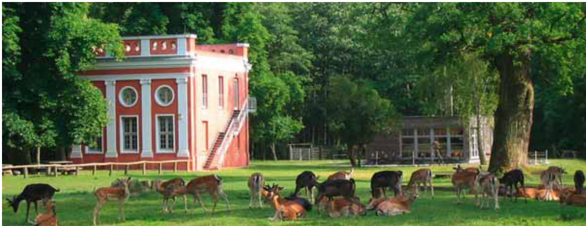
Die Ivenacker Eichen wären ohne Waldweide undenkbar. Noch heute wird diese zur Erhaltung der typischen Waldbilder angewendet

Die Gründe dafür waren so plausibel, dass die Ivenacker Eichen am 4. August 2016 im Rahmen eines Festaktes durch Minister Dr. Backhaus als erstes Nationales Naturmonument in Deutschland ausgewiesen wurden.