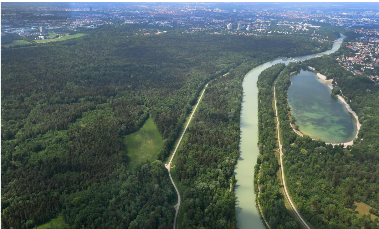
Stadtwald von oben