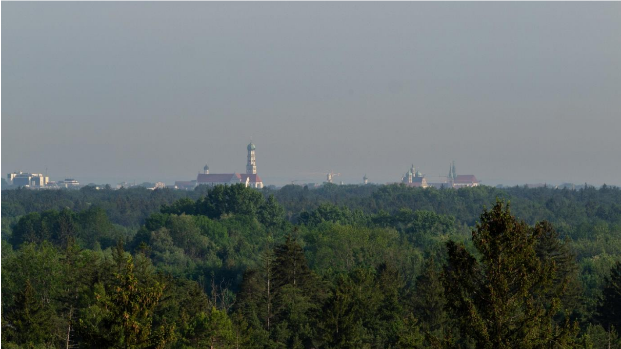
Stadtwald mit Augsburgs Wahrzeichen im Hintergrund